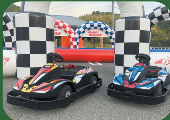
ワンコインゴーカート!