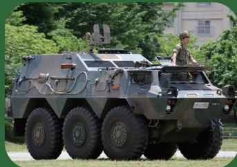
自衛隊車両もやってくる!