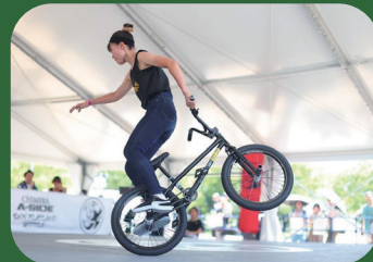
BMX パフォーマンス & 体験会