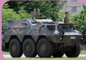
自衛隊車両がやってくる!