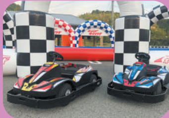
人気のゴーカート!